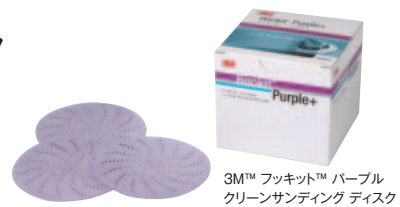
3M™ フックキット™ パープル クリーンサンディング ディスク