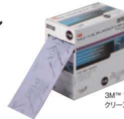
3M™ フックキット™ パープル クリーンサンディング シートロール