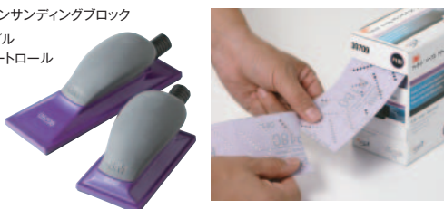
3M™ フックイット™ クリーンサンディングブロック 3M™ フックイット™ パープル クリーンサンディング シートロール