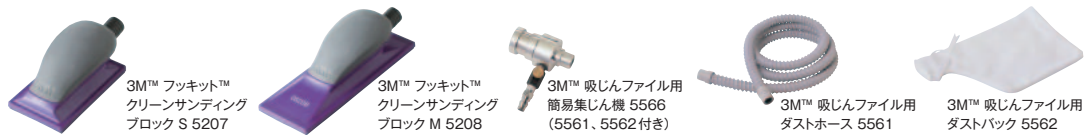
3M™ フックキット™ クリーンサンディング ブロック S 5207