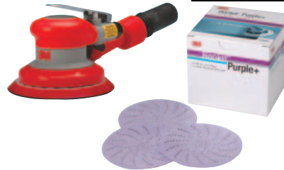
3M™ ダブルアクションサンダー 3M™ フックイット™ パープル クリーンサンディングディスク