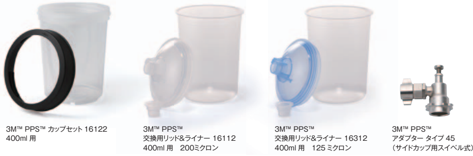
3M™ PPS™ カップセット 16122 400ml 用